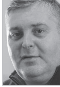
Կարդացե՛ք էջ 6

Ես իմ կոլեգաներից շատերի մասին վատ բան չեմ ուզում ասել, բայց ցավով եմ տեսնում, եւ դա նոր չէ, գալիս է դեռ ԽՍՀՄ-ից, որ մերոնք ավելի շատ պրոպագանդիստներ են, բան՝ արվեստագետներ... Նախարարությանը կից աշխատակիցներ: Այդ մտածելակերպը մինչեւ դուրս չգա, վիճակը չի փոխվի: Չի կարող մտավորականը լինել վախկոտ: