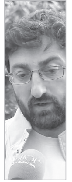
Հարցազրույց ռեժիսոր, հասարակական գործիչ Յովհաննես Հոխանյանի հետ

- Եթե օրինական լինի, հնարավոր է, բայց մենք տեսնում ենք, թե Եվրոպան ինչպես է միջամտում, ինչ հիբրիդային սպանդ է իրականացնում, նաեւ՝ Թուրքիան եւ Ադրբեջանը, չեն էլ թաքցնում: Տեսանք, բարոզարշավի ժամանակ մարդ սպանեցին՝ Արմեն Հովհաննիսյանին, պետական սպանություն էր դա, մարդուն հասցրին նրան, որ ինքնասպան լինի: Տեսնում ենք, որ իրենց նախընտրական ծրագրում հստակ խոստում կա՝ եթե իշխանության գան, Սահմանադրությունը խախտելու են՝ կաթողիկոսին եկեղեցուց հեռացնելու են: Սահմանադրության