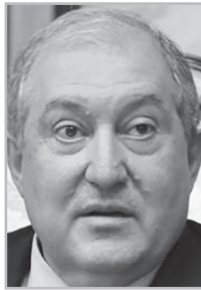
Կարդացե՛ք էջ 4

Միայն այն, որ ՀՀ ՆԳՆ-ն ինքնաբերաբար Փաշինյանի ցուցումով պատգամավորական թեկնածուների երկբաղաբացության հարցերով է զբաղվում, արդեն ծիծաղ է առաջացնում: Որտեղ էր այդ ՆԳՆ-ն, երբ Մեծ Բրիտանիայի քաղաքացի Արմեն Սարգսյանը Հայաստանում պաշտոնավարում էր որպես Նախագահ՝ Նիկոլ Փաշինյանի սուտ վկայությամբ: