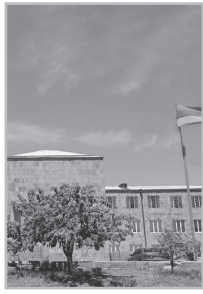
Կարդացե՛ք էջ 4

Նիկոլին ընտրելու 4 վարիանտ կա, այսօր ինձ բացատրեց տաքսու վարորդը,- մեկը՝ որ գնաս, իրեն ընտրես, երկրորդը՝ որ գնաս, քվեաթերթիկն անվավերացնես՝ փչացնես, երրորդը՝ որ չգնաս ընտրության, պառկես դիվանին ու սաղից զզվես: Եվ չորրորդը՝ որ ընտրես այն մանր-մունր ընդդիմադիրներից որտե՛ս մեկին՝ ձայնդ փոշիացնես: