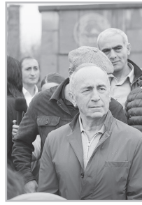
Կարդացե՛ք էջ 5

Քարոզարշավի առաջին 10 օրը կարելի է գնահատել որպես բացահայտման 10-օրյակ: Ընդդիմությունը, որի ակտիվությունը չէր գոհացնում բավարար չէր, այս 10 օրերի ընթացքում բավականին ակտիվ ու գրագետ արշավ իրականացրեց: Պայթարի մեկնարկը հուսադրող է եւ գոհացուցիչ: Մարդիկ տեսան հստակ իր տեսակետը հայտնող ընդդիմություն: