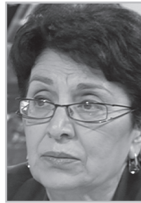
Կարդացե՛ք էջ 6

Ա նցյալ օրը գոռում, ճվում էր ընտրարշավի ժամանակ, թե մարդիկ կան, որոնք ուզում են դառնալ վարչապետ, գլուխները պատերին են տալիս: Ապշում եմ՝ ինչ է նշանակում, այսինքն՝ վարչապետի աթոռը սեփականաշնորհել ես այնպես, որ ով ուզի դառնալ վարչապետ, գլուխը պատիվ պիտի տա: Հասկանում եք, թե ինչ անտրամալ իրավիճակում ենք: