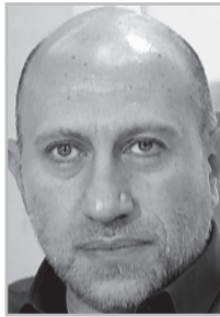
Կարդացե՛ք էջ 4

Կ արեւոր է չբերել հարաբերություններն այդպիսի կետի, երբ դիվանագիտությունը, ներողություն եմ խնդրում ընթերցողից մի քիչ ժողովրդական եւ ոչ գրական այս ձեւակերպման համար, վերածվում է մանր շուտորիության: Բայց, ցավոք սրտի, մենք գործ ունենք Հայաստանի արտաքին քաղաքականության այսպիսի տրանսֆորմացիայի հետ: