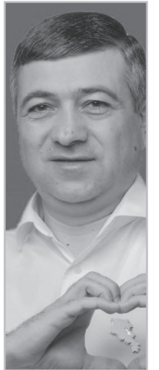
Նյութերը՝ Լուսինե ՇԱՀՎԵՐԴՅԱՆԻ

Պետական ապարատն ու դպրոցները կուսակցականացնելու համար նախկիններին բզկտող Նիկոլ Փաշինյանն այս հարցում էլ կատարելագործել, ծաղկեցրել է ՀՀԿ-ի հիմնածավանդությունները: