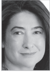
Կարդացե՛ք էջ 4

Մ արտի վերջին երեւան էին ժամանել ամերիկացի եւ եվրոպացի լրագրողներ: Այս մեղիա տուրին, պարզվում է, մասնակցել է նաեւ ազգությամբ թուրք մի լրագրող՝ թուրքական եւ ամերիկյան շրջանակներին հայտնի լրագրող Բարչին Յինանչը, որը, վերադառնալով իր երկիր, հրապարակում է արել նախընտրական Յայաստանում տիրող իրավիճակի մասին: