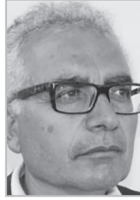
Կարդացե՛ք էջ 6

Ք այերն իրենց պատմական հայրենիքում ոսկորի պես խրված են նրանց կոկորդում, նրանք ուզում են մեզնից ազատվել: Ի՞նչ խաղաղության պայմանագիր, ի՞նչ հաշտություն: Եղ ովքեր են խաղաղություն կնքողները: 2 արկածախնդիր կառավարիչներ՝ Յայաստանից եւ Ադրբեյջանից: Դուք հայ ժողովրդի ճակատագիրն եք որոշում, դուք ովքեր եք: