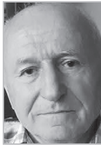
Կարդացե՛ք էջ 6

Հ այ ժողովուրդ, ինչպես կարող ես թույլ տալ, որ պետական դավաճանը Նորից գնա ընտրությունների, վերարտադրվի եւ ավարտին հասցնի մեր երկրի կործանումը: Հարկավոր է արգելափակել նրա ընտրվելու իրավունքը, ուղարկել բանտախուց եւ կազմակերպել արդարացի ընտրություններ: Միացյալ ընդդիմություն, ոտքի հանիր ժողովրդին: