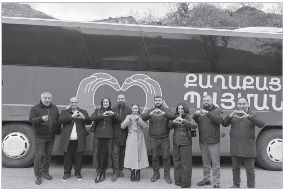
ԶՊ շարքերում խոր անորոշություն է, ցուցակի 50-յակում չընդգրկվածները չեն թաքցնում, որ անկյուն են սղվել եւ չեն պատրաստվում իրենց կտորել՝ քարոզչությանը զբաղվել: Փաշինյանը որոշել է պաշտոնական քարոզարշավին ցուցակի առաջին 50-յակի հետ շրջել, եթե բացականչել լինեն, նոր հաջորդ համարները կզնան: Եվ 50-ից հետո ընդգրկվածների թիվ մեկ խնդիրը դարձել է իրենց ապագա աշխատավայրի եւ մերձավորներին տեղավորելու հարցը: Չսայած Փաշինյանը վարչության անդամների միջոցով փոխանցել է, որ ոչ մեկն անգործ չի մնա, եթե հաղթեն, բայց պետք է ընտրություններին բոլորը «վիզ դնեն», սակայն նրանք վստահ չեն հաղթանակի հարցում եւ չեն հավատում ստելու մեծ վարպետ Փաշինյանի խոստումներին: