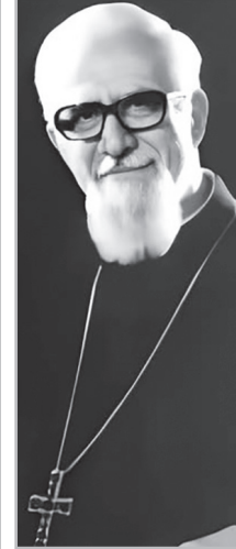
Նյութերը՝ Նարեկ ՀԱՐՈՒԹՅՈՒՆՅԱՆԻ

1964-76 թթ. դարձել է Մխիթարյան միաբանության ընդհանուր քարտուղարը, որից հետո Սբ Ղազարի ձեռագրատան պատասխանատուն: Իսկ 1991 թ. Հովհաննես-Պողոս Բ պապի կողմից նշանակվել է Հայաստանի, Վրաստանի ու Արեւելյան Եվրոպայի կաթողիկե առաջնորդ: 1992-ին Պապի կողմից օծվել է տիտղոսավոր արքեպիսկոպոս՝ առաջնորդական Աթոռը Գյումրիում: 2005 թ.՝ 75 տարեկանում, առաջնորդի պաշտոնից հրաժարական է ներկայացրել Պապին: Կարճատեւ հիվանդությունից հետո մահացել է 2006 թ. դեկտեմբերի 24-ին, Աշոցքի իտալական հիվանդանոցում: Թաղվել է Փանիկում: