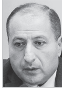
Կարդացե՛ք էջ 5

Կոչ եմ անում իմ փաստաբան գործընկերներին՝ այս հարցերով զբաղվել: Պետք է շատ կտրուկ քայլերի դիմել, նախադեպեր ստեղծել: Պետք է ալգորիթմներ մշակել, որպեսզի Ձեռնարկային կոմիտեին, դատախազությանը կարգի բերենք: Վաղն էլ կարող են իրենց մեղադրանք առաջադրել: Այդպես է այսօր դու ես մեղադրանք առաջադրում, վաղը՝ քեզ: