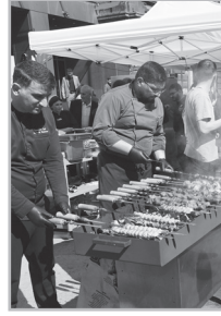
Կարդացե՛ք էջ 6

Ա պրիլի 24-ին եւ 25-ին հետեւել են հուշահամալիր գնացող եւ «քաղաքացու օր նշող» քաղաքացիների դեմքերին: Դրանք նույն մարդիկ չէին, եւ կասե՛ի՝ անգամ նույն ազգից չէին, նույն հոգն ու մտքերը չունեին, տարբեր էին այնքան, որ գուցե ոչ էլ նույն մոլորակից էին: Ուրեմն կան երկու տեսակի քաղաքացիներ, երկու Հայաստան: