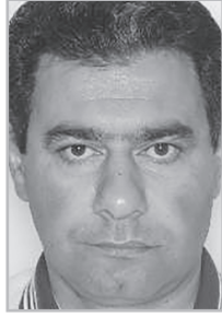
Կարդացե՛ք էջ 6