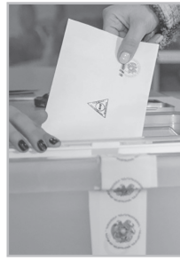
Կարդացե՛ք էջ 6

Թ ալանչի Նախկինների մասին բալլադներին այսօր ավելացել են կալուզացի օլիգարխի «արկածները», որոնք ամեն օր հեքիաթի պես պատմում են ԶՊ-ական պաշտոնյաները՝ մտածելով, թե Նորից կարող են հեղափոխություն անել, չհասկանալով, որ իրենց կողմակիցներն արդեն բավականին փոքրաթիվ են՝ հեղափոխական այլք առաջացնելու համար: