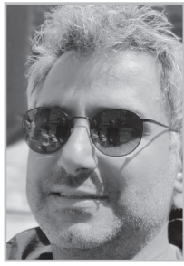
Կարդացե՛ք էջ 4

Գ ործ ունենք մի խմբակի հետ, որ երկար տարիներ երազել է գալ իշխանության, ստացել է եւ պատրաստ է այդ նույն իշխանությունը պահելու համար գրել, բառի բուն իմաստով՝ ամեն ինչ: Չենք զարմանա, որ մի օր սա հեռուստացույցով լայվ մտնի՝ մարդ ուտի, եւ մարդիկ արդարացնեն: Այդ տեսակ բարոյականության մեջ ենք մենք ապրում: