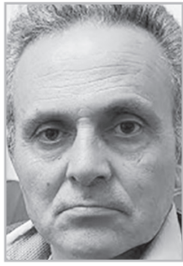
Կարդացե՛ք էջ 5

Մենք Կրաստանում դա տեսել ենք, դրա միջով անցել ենք, Սահակաշվիլուց ինչպես ժողովուրդն ու երկիրը տուժեցին: Եթե Հայաստանից եկող զբոսաշրջիկներին թվում է, թե մենք շատ լավ ենք ապրում, միայն թվում է, մենք գիտենք, թե ինչ հետեւանքներ ունեցավ Սահակաշվիլու վարած քաղաքականությունը, ոչ թե ներկա իշխանությունների: