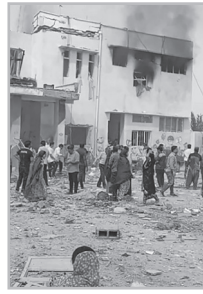
Կարդացե՛ք էջ 6

Սրտիկ սիմվոլը հասուն մարդուն բնորոշ քայլ է, փաստում է մարդու մակերեսայնության մասին: Սրտիկի տակ գրված «խաղաղությունը» կապ չունի իրական խաղաղության հետ, անամպ երկինքը՝ Հայաստանի երկնքի հետ: Սիրտը սովորաբար սիրո սիմվոլիկ է, բայց այն ատելության մթնոլորտը, որ այժմ տիրում է Հայաստանում, անսախաղեպ է: