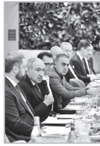
Կարդացե՛ք էջ 7

Բ իզնեսմեններն էլ են, ախր, հետաքրքիր մարդիկ: Փոխանակ իրենք հրավիրեն եւ Ձախորդ Փանոսին, հանդիմանելիս վերջին 8 տարիներին հայկական բիզնեսի գլխին բերած չարիքների համար, մի բան էլ իրենք էին վազել՝ հանդիպելու նրա հետ, նախաճաշելու: Ինչքան իրար հակասող (ներմուծող-արտահանող) բիզնեսմեն կար, այնտեղ էր: