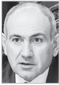
Կարդացե՛ք էջ 2

Ե Մ Եւերգետիկայի հանձնակատար Դեն Յորգենսենը երկու օր առաջ ԵՄ քաղաքացիներին կոչ է արել՝ ինչպէս վառելիքը աշխատել տնից, վարել ժամում 10 կիլոմետր ավելի դանդաղ եւ օգտագործել գնացքներ՝ ինքնաթիռների փոխարեն: «Նույնիսկ եթէ վաղը խաղաղություն գա, մենք շուտով չենք վերադառնա Նորմալ կյանքի»,- ասել է նա: