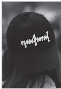
Կարդացե՛ք էջ 5

Հ այաստանը կանգնած է ճակատագրական խնդիրների առջեւ: Վարչապետի վերջին ելույթը Եվրոպայում, նրա հակահայկական գործողությունները, ամենօրյա խոսույթը ոչ միայն չեն պաշտպանում մեր ժողովրդի շահերը, այլեւ խորացնում են ներքաղաքական ճգնաժամը, թուլացնում պետական ինստիտուտները, սպառնում ազգային անվտանգությանը: