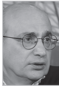
Կարդացե՛ք էջ 7

Փ ործում է հիշեցնել 2020 թ. սեպտեմբերի 27-ը, այսինքն՝ այս սեպտեմբերին նույնպես պատերազմ կլինի: Սա շանտաժ է, որովհետեւ Ադրբեյջանը չի որոշում՝ Հայաստանի հետ պատերազմի, թե՛ ոչ, ոչ էլ 2020-ին էր որոշել: Դա աշխարհաքաղաքական գործողություն էր, Ադրբեյջանին աջակցում էին Իսրայելը, Մեծ Բրիտանիան, մյուսները: