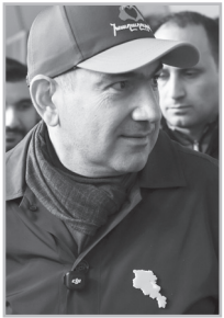
Կարդացե՛ք էջ 4

Այն բարտեզից, որ ԶՊ-ի ռազմավարական խիզախ է դռնին ու ֆոֆոնում է, ունի նաև Ալիեյը: Նույն բարտեզն է, պարզապես մեկի վրա գրված է «Իրական Հայաստան», մյուսի վրա՝ «Արեւմտյան Ադրբեջան»: Չեմ զարմանա, եթե մի օր պարզվի, որ այդ բարտեզ-կրծքանշանն արտադրվել է Ադրբեջանում եւ Հայաստան ներկրվել ադրբեջանական բենզինի հետ: