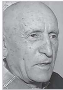
Կարդացե՛ք էջ 5

Գեմ դիմում բաղաբալան գործիչներին, դիմում եմ մտավորականությանը. պիտի խոսել, թույլ չտալ, որ ժողովուրդը, թեկուզ ժամանակավոր՝ հավատա այդ կեղծ տեսություններին: Ժողովուրդն իր պատմությունն ունի, եւ այն պետք է շարունակվի: Մենք չենք կարող Վանա լճից, Սասունից հրաժարվել, սփյուռքահայությունից հրաժարվել: