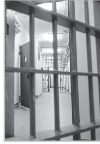
Կարդացե՛ք էջ 7

Ազոտը կտրուկ բարձրանում է, թեթալին անբավարարություն, ասթմա, ճնշում, շնչահեղձ է լինում: «Արմավիրից» ետապ արեցին «Սեւան» ու էլի հետ քերեցին: Ո՛չ բուժել կարող են, ո՛չ էլ բաց են թողնում: Հիմա բերո՞ւ ենք ուղարկել, թե՛ մահվան: Հիվանդանոցները չեն ընդունում, հետո՞ ինչ, որ դատապարտյալ է, ուրեմն պետք է մեռնի: