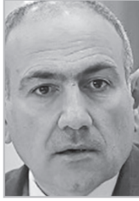
Կարդացե՛ք էջ 6

Մենք՝ ներքստորագրյալ լրագրողներս, խոնարհաբար դիմում ենք Ձերոջ Վսեմությանը, ինդրելով մեզ տրամադրել բառարան, որը կհաստատվի անձամբ Ձեր կողմից, կկնքվի եւ կպարունակի այն բառերի, բառակապակցությունների ու նախադասությունների ցանկը, որոնք թույլատրելի են կիրառել՝ առանց Ջրեական օրենսգրքի թիրախ դառնալու: