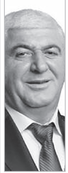
Նյութերը՝ Նելլի ԿԱՐԱՊԵՏՅԱՆԻ

ՀԳ. Մենք կիտեղենք, թե այս տարածքի հետ կապված մրցույթը երբ է կայանալու, եւ ով է դառնալու մրցույթի հաղթողը: