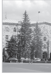
Կարդացե՛ք էջ 5

Գ րում են. «պարզեատրվել է նախարարության կողմից», «իրականացվել է համայնքի կողմից»: Ինչո՞ւ այս ծանր, արհեստական կառույցները, երբ կարելի է գրել պարզ ու հայերեն. «նախարարությունը պարզեատրեց», «համայնքն իրականացրեց»: Նույնը՝ «շրջանակում»-ի դեպքն է. այն դարձել է յուրաքանչյուր խոսքի պարտադիր հավելում: