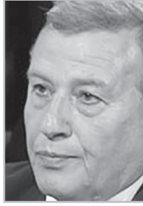
Կարդացե՛ք էջ 4

Օ դային տարածքի օգտագործում կարող է լինել ստուգումներ անցկացնելու արդյունքում: Թուրքիան, օրինակ, այդպես է անում: Ոչ մի բեռնատար դեպի Հայաստան եւ Կիպրոս, նաեւ՝ ՀՀ-ից եւ Կիպրոսից, թույլ չի տալիս, բայց երբ Հայաստանից Սիրիա օդային բեռ էին տանում, թողեց, սակայն՝ միայն ստուգումներ անցկացնելուց հետո: