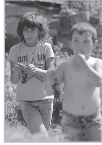
Կարդացե՛ք էջ 6

Կ րթության նախարարությունը, մեր հարցին ի պատասխան, մի հսկայական գրություն է ուղարկել, սակայն չի նշել ամենակարեւորը, թե քանի երեխա է դուրս մնացել պարտադիր կրթության համակարգից: Նույն հարցը գրավոր ուղարկել էինք ՏԿԵՆ, որտեղից մեզ պատասխանել են, որ մոտ 300 երեխա է դուրս մնացել հանրակրթությունից: