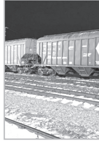
Կարդացե՛ք էջ 6

Էկոնոմիկայի նախարար Գեորգ Պապոյանն անամոթաբար ստել է Ղազախստանից ցորենի նոր խմբաբանակներ ներմուծելու մասին: Նոր ներմուծումներ չեն եղել, 2025-ի նոյեմբերին ներմուծված IV կարգի եւ տոբակներով վարակված խմբաբանակի թեման հասել է ՀՀ դատախազություն եւ ՆԳՆ Քրեական ոստիկանություն: