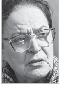
Կարդացե՛ք էջ 4

Ես պնդում եմ, որ մեր բաղաձայնական պատանդների վերադարձի ամենամեծ խոչընդոտը ՀՀ օրվա վարչակազմն է: Ինչո՞ւ: Որովհետեւ մենք լսել ենք վարչապետին ոչ հարիր հարցադրում, մասնավորապես՝ Ռուբեն Վարդանյանի մասին, թե մենք դեռ պետք է իմանանք՝ Ռուսաստանն ինչու է ուղարկել նրան: Կներե՞ք, դրանք «դատուցիկի» խոսքեր են: