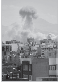
Կարդացե՛ք էջ 4

Ք անի դեռ Չինաստանը ռազմական առումով թույլ է կամ բավարար համարձակություն չունի՝ պաշտպանելու իր դաշնակից երկրներին, ԱՄՆ-ն կարող է ռազմական գերիշխանություն հաստատել դրանցից յուրաքանչյուրի նկատմամբ: Առաջին հարվածը հասցվեց Վենեսուելային, որը Չինաստանի նավթի հիմնական մատակարարներից էր: Երկրորդը Իրանն էր: