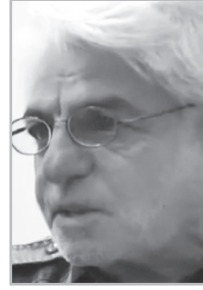
Կարդացե՛ք էջ 5

Գ նահատման չափորոշիչ սահմանելիս Բնապետը պարզեց կամ պատժի չափման միակերպ օգտագործում «ստորաս» անվամբ գնահատման միակերպ բաղկացած «ստոր» եւ «աս»-աստիճան արմատներից, ինչը նշանակում է «ստորության աստիճան» կամ «ստորաբարձրության աստիճան»: Ամեն մեկի համար սահմանել էր «ստորաս»-ի աստիճաններ: