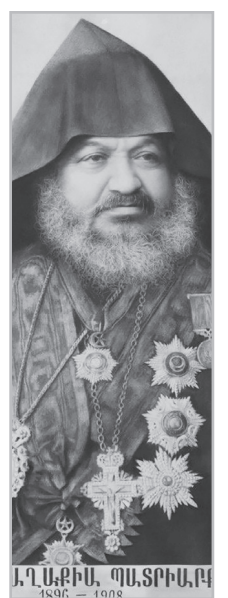
Կ.ՂԱԳԻԿ, ՊԱՏՐԻԱՐԿ 1896 - 1908

Այսօրվա լույսի ներքե՝ Օրմանյանը հավատքի եւ գիտության, պահպանողականության եւ քաղաքական հավասարակշիռ մտածողության, դիվանագիտական ճկունության եւ լուրջ կառավարչական կարողություններով անձ էր: Օրմանյան պատրիարքի քաղաքական մտածողությունը դրսեւորվում է դեռ 1870-ականների կեսերին իտալական ազգային ազատագրական պայքարի առաջնորդ Ջուզեպե Գարիբալդիի հետ հանդիպման եւ իտալացի ու հայ ժողովուրդների ազգային ազատագրությանը վերաբերող հարցերի բնարկման ժամանակ: Նույն տարում Օրմանյանն ընտրվել է եկեղեցական համագումարի պատգամավոր, կրոնական ժողովի անդամ եւ ապա՝ Եգիպտոսի հայոց թեմի առաջնորդ, բայց հրաժարվել է ստանձնել այդ պաշտոնը: Պատրիարքությունը թողնելուց հետո, կյանքի վերջին տարիներին նա ապրել է Երուսաղեմի Սբ Հակոբյանց վանքում, այնտեղ վարել պաշտոններ, դասավանդել տեղի ճեմարանում: 1918-ին վերադարձել է Կ. Պոլիս, որտեղ էլ վախճանվել է: