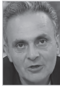
Կարդացե՛ք էջ 5

Ո ղիկ հեռարձակմամբ հետևում էի, տեսա, որ 10 եպիսկոպոսների առաջնորդությամբ այնտեղ գնացած մարդիկ ծամոն էին ծամում, ձեռքի միջև մատն էին ցույց տալիս, ոմանք հարբած էին: Գիտեք, շատ վատ է, որ նման կեղտոտ խավին իրավունք են տալիս ինչ-որ հարց որոշել: Իսկ հետագա զարգացումների մասով, Աստված տա, որ սխալվեմ: