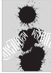
Կարողացե՛ք էք 5

«Ք աղաքացիներին հաճոյանալու համար հոսանքի գինը չպիտի իջեցնել, որպեսզի 3 տարի հետո պորբլեմ չառաջանա...»: Խորատուվիր մտքի այս ջինջ օվկիանոսի ջրերի մեջ, փորձիր մի բան հասկանալ: Մտքի տիտան մեր առաջնորդը գտնում է, որ չի կարելի ժողովրդաշահ գործ ձեռնարկել, ինչն առաջարկել է ՅԵՑ-ի նախկին տնօրինությունը: