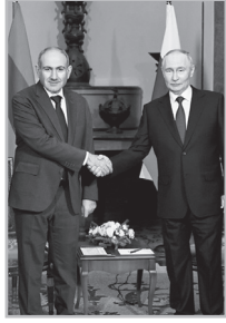
Կարողացե՛ք էք 4

Ա տոմակայան ունեցող Հայաստանը համարյա ատոմային տերություն է, էներգետիկ անկախություն ունեցող երկիր: Ատոմակայան չունեցող Հայաստանն իրենցից կախված, ոչ մրցունակ, թերզարգացած, մնացորդային մի բան է: Ատոմակայանը Հայաստանի տնտեսության լոկոմոտիվն է, եթե այն գնա, իր հետեւից ամբողջ երկիրը կտանի, կբաշի առաջ: