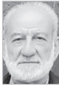
Կարդացե՛ք էջ 5

Օ րերս իմ փաստաթղթերի հավաքածուի մեջ պատահաբար աչքովս ընկավ «Հայկական ժամանակ» թերթում 2008 թ. տպագրված՝ «Հեղինակի անունը կարելու չէ» վերնագրով հոդվածը, որտեղ նկարագրվում է Կոնյան Նավասարդ արքեպիսկոպոսի «Քաջագործություններից» մեկը՝ Խաժակ արքեպիսկոպոս Պարսամյանի «կնքահայրությամբ» իրականացված: