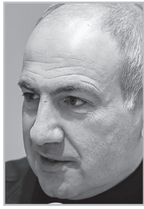
Կարդացե՛ք էջ 4

Չ հասկացող խավի մեջ ձեռավորվել է թյուր կարծիք, թե խորհրդարանական կառավարումը վատ բան է, ու մեր դժբախտությունը կառավարման մոդելի մեջ է: Բայց մոռնել մեղք չունի: Այլ հարց է, թե ով է կառավարիչը: Նիկոլը դառնար 33 նախագահ՝ ամեն ինչ ավելի վատ էր լինելու, բան հիմա, երբ նա վարչապետ է կամ «սուպերվարչապետ»: