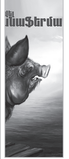
Էդիկ ԱՆԴՐԵԱՅԱՆ edik.andreasyan @hraparak.am

- Եղ հում դեզն էիք ուզում տանել, արա... Բայց դուք մի վախեցե՞ք, ես շնորհակալ եմ ձեզանից, իմ աչքը վաղուց ձեր ազարակի վրա էր: Ես ձեզ չեմ մորթի, դուք ինձ դեռ պետք եք: Ես իմ անասունների մի մասին կքշեմ այստեղ, իսկ դուք, ձեր լափի դիմաց, տիրություն կանե՞ք նրանց ու կշատացնե՞ք: Նըղդիմ Նապոլեոն...: