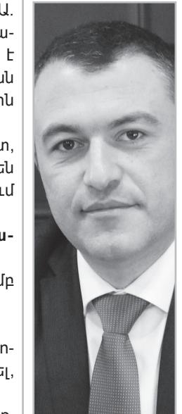
Նյութերը՝ Աննա ԴԱՊԻԿՅԱՆԻ

Սուրեն Թովմասյանը, հիշեցնենք, իշխող «Զաղաքացիական պայմանագիր» կուսակցության անդամ է: Նիկոլ Փաշինյանի որոշմամբ է նշանակվել այս պաշտոնին՝ 2019 թվականին: Ի դեպ, դաժան ծեծի դեպքից 2 օր հետո լրագրողի հարցին, թե հեղափոխության նպատակն այն էր, որ նման դեպքերում իր թիմակիցները մասն անպատիժ, Նիկոլ Փաշինյանն ասել էր. «Ինձ հայտնի չէ, որ Կադաստրի կոմիտեի ղեկավարի մասնակցությամբ որեւէ միջադեպ եղել է»: