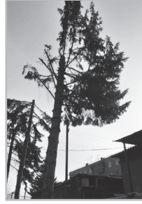
Կարողացե՛ք էք 6

Սա ոչ այլ ինչ է, քան թշնամություն, ատելություն քաղաքի նկատմամբ: Ես դարավոր ծառերը, որոնք ես քաղաքի շքեղությունն էին ապահովում, ծիծաղելի տեսք են ստացել: Մի կայեք՝ ոնց են կոտորել: Մարդիկ դուրս եկան, բողբոջեցին, բայց ո՞վ է Հայաստանում մարդկանց լսում: Ծառն ո՞ւմ էր խանգարում, թթվածին պետք է շնչեցին: