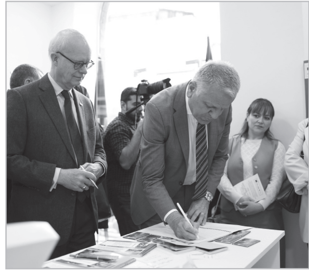
Նախորդ հոդվածը՝ 1.11.2025թ. համարում

Սյունիքի մարզպետի հետ դեսպանների փակ հանդիպումից հետո ծրագրված էր այցելություն Կապանի Արվեստի թանգարան: Այդ թանգարանը, ցուցադրված կտավները, դրանց միտքը, ժանրային բազմազանությունը, Ես թեմտիկան տպավորում էին վայրկենապես: Արեւելյան Եվրոպայի համարյա բոլոր երկրներում, որտեղ ես եղել եմ՝ Սլովակիա, Լեհաստան, Ուկրաինա, Լատվիա, Հունգարիա, Մոլդովա և այլն, եղել եմ նաև իրենց թանգարաններում, պատկերասրահներում և առանց չափազանցության կարող եմ ասել, որ այդ երկրների ոչ մի պատկերասրահ չունի կերպարվեստի այդքան տպավորիչ գործեր և հարուստ հավաքածու, ինչպիսին ցուցադրված էր Կապանի թանգարանում: Դա էլ երկրորդ վկայությունը Կապանի՝ մայրաքաղաքային աուրայի ու Եուրոպան: