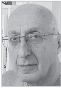
Կարդացե՛ք էջ 4

Զ ստրտած դասերի համար թանկ գին են վճարում եւ գոհերը, եւ դահիճները: Շատ ժողովուրդներ են անցել (ու շարունակում են անցնել) բռնապետության քավարանը: Արեւմուտքը Հայաստանում էլ է նույն սխալը գործում՝ մայրուն արժեքները ստորադասելով վաղանցիկ կայունությանը: Այս realpolitic-ի շահառուներն են նաեւ ԶՊ-ականները: