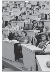
Կարդացե՛ք էջ 6

Ս ահմանամերձ գյուղերից մեկի քիմիայի բազմավաստակ ուսուցչուհին 4-րդ անգամ է «կտրվել» կամավոր ատեստացիայից: Նա շատ հարգված է դպրոցում, նրա սաները տարիներ շարունակ բուհեր ընդունվելիս ցուցաբերել են հիմնավոր գիտելիքներ եւ քիմիայից ստացել բարձր միավորներ, պարգևով է՝ չի բավարարում ատեստացիայի պահանջները: