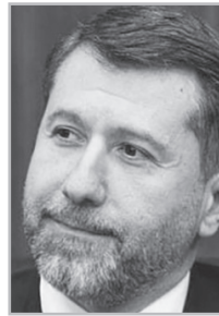
Կարդացե՛ք էջ 5

Ա յն, որ Գ. Մինայանն ու Անդրեասյանը սխալ են արել, փաստվել է ՄԻԵԴ եւ ՄԴ որոշումներով, այն, որ ներկայիս ԲԴԽ կազմը չգիտեմ ինչ հրաշքով կամ պատճա-ռաբանություններով լիազորությունների վերականգնման պատասխանատվության ենթարկելը մերժելու վերաբերյալ որո-շումներ չի կայացրել, դեռ չի նշանակում, թե իրենք ճիշտ են: