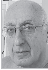
Կարդացե՛ք էջ 4

Պ ետք է տեղական վճարների եւ տուրքերի այնպիսի համակարգ ստեղծել, որտեղ գործում է «Շատ աղտոտողը շատ է վճարում, քիչ աղտոտողը՝ քիչ» սկզբունքը: Այս մոդելը մերժում է համահարթեցումը: Կառավարությունը, բաղադրատարրերը պետք է անկախ մշտադիտարկման հնարավորություն տան գիտնականների, բժիշկների, լրագրողների խմբերին: