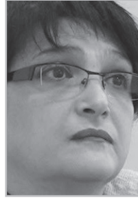
Կարդացե՛ք էջ 6

Ա յդ հայտարարությունը նշանակում է մի բան. նա Ալիեւին ասել է՝ ինձ պաշտպանեք, ֆինանսավորեք, երաշխավորեք իմ անվտանգությունը, փող տվեք, որ ես կարողանամ թիկնապահներ վարձեմ այդքան շատ, ոստիկաններին մեծ, ահռելի աշխատավարձեր տամ, եւ ես կանեմ այն, ինչ դուք ցանկանում եք: Ալիեւը, վստահ եմ, չի մերժել Փաշինյանին: