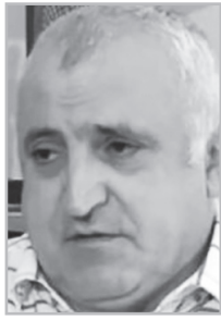
Կարդացե՛ք էջ 4

Ա նկեղծ ասած՝ Նիկոլ Փաշինյանի քայլերը հոգեկան խնդիրներ ունեցող մարդու գործողություններ են հիշեցնում: Նրա արարքները պետք է զննության ենթարկեն հոգեբույժները, հոգեբաններն անգոր են: Ես կարող եմ ասել մի բան, որ Փաշինյանի գործողությունները հասարակության վրա առաջվա համեմատ շատ քիչ ազդեցություն են թողնում: