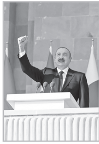
Կարդացե՛ք էջ 5

Բ աբվի շքերթին մեծ թվով հյուրեր մասնակցեցին, սակայն Ադրբեջանը ծանր է տարել ոմանց բացակայությունը և սկսել է «ներկա-բացակա» անել, թե ովքեր են ինչու չայցելեցին Բաբու՝ զորահանդեսին մասնակցելու: Իշխանամերձ կայք Minval Politika-ն պարզել է, որ շքերթի ժամանակ տրիբունաներում եղել է 75 երկրի ներկայացուցիչ: