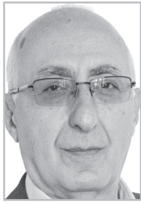
Կարդացե՛ք էջ 5

Ե կեղեցու թուլացումն ինքնաբերաբար չի ստեղծի նոր ինքնություն: Եթե վերացնենք պատմականորեն հաստատված հոգեւոր հավասարակշռությունը, ապա վերականգնման հնար այլեւս չի լինի: Միթե իշխանության մեջ չեն մնացել մարդիկ, ովքեր ունակ են հասկանալու, որ հոգեւոր-մշակութային ժառանգությանն օտար է խուճակի խեղությունը: