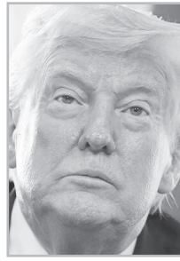
Կարդացե՛ք էջ 7

Պ արոն Նախագահ, մոռացել եք Ձեր Նշած 23 հայ քրիստոնյաների եւ Փաշինյանին ուղղված Ձեր խնդրանք-հորդորի մասին, թե՛ միայն արյունահեղությունը կստիպի Ձեզ՝ հիշել Երեւանի եւ Բաքվի բանտերում խոշտանգվող, հալածվող հայ քրիստոնյաների մասին... Միթե պետք է Նիգերիացի քրիստոնյա լինենք, որ Ձեզ մտահոգի մեր ճակատագիրը: