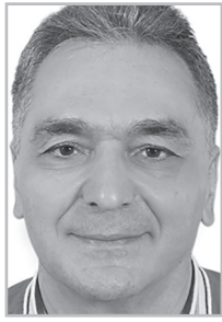
Կարդացե՛ք էջ 4

Ե թե Թեյ Ավիլը հետեւեր Նախահարձակ չլինելու, իր տարածքից դուրս կանխարգելիչ հարվածներ հասցնելու արգելքի ռազմավարությանը, Խորալե պետությունն այսօր գոյություն չէր ունենա: Որովհետեւ պարտված կլիներ 1967 թ. պատերազմում: Ինչպես գոյություն չունի Արցախը, որը Նախահարձակ չեղավ եւ կանխարգելիչ հարված չհասցրեց: