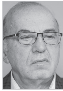
Կարդացե՛ք էջ 5

Մարդիկ թշվառ վիճակում են, չգիտեն՝ վաղն ինչպես են հայթայթելու իրենց «հաց հանապազօրյան»: Մեր քաղաքացիների զգալի մասն աշխատող աղքատներն են, որովհետեւ նրանց նվազագույն աշխատավարձը, բոլոր օրենքներին հակասելով, հարկվում է, իսկ նվազագույն աշխատավարձը որեւէ երկրում չեն հարկում. դա գոյատեւման աշխատավարձ է: