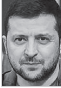
Կարոպետ Էջ 4

Փ աշինյանի ռեժիմը, թվացյալ չեզոքություն պահելով, իրականում խաղաղույթ արեց Ուկրաինայի հարթամակի վրա: Նախ՝ սառեցրեց հարաբերությունները ՀԱՊԿ-ի հետ, հումանիտար աջակցություն ուղարկեց Ուկրաինա եւ պատերազմն օգտագործեց՝ Հայաստանը ռուսական ազդեցությունից Թուրքիա-Ադրբեջան ազդեցության գոտի տեղափոխելու համար: