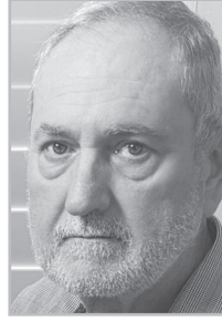
Կարոպետ Էջ 5

Ե րբ իշխանությունը հետևողական կերպով կվարկաբեկի Եկեղեցին եւ անոր հոգևոր դասը, դժվար է գայն ներկայացնել իբրեւ պարզ բարեփոխման գործընթաց: Անշուշտ, Հայոց եկեղեցին եւս ունի իր ներքին խնդիրները, որոնք պետք է սրբագրվեն: Սակայն խնդիրների լուծումը եւ կառույցի հեղինակագրվումը կամ բանդումը տարբեր բաներ են: