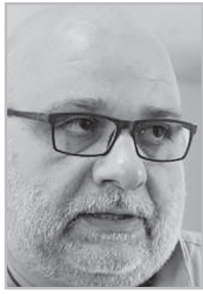
Կարդացե՛ք էջ 4

Երբ մեկը մի հաջող գազալցակայան բացի, մյուսը, փոխանակ այն ամբողջացնող մի քիզնե ընտրի ու դնի նրա մոտ, կգա, ճիշտ նույն ծառայությունը մատուցող մի գազալցակայան էլ ինքը կբացի՝ ճիշտ նրա կողքին: Երրորդը կանի նույնը... Զետեաբար, եթե մեկ հոգին, լինելով սեփականատերը, շահ էր գրանցելու, հիմա երեքով վնասվելու են: