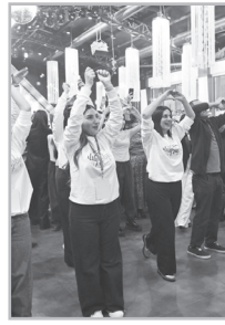
Կարդացե՛ք էջ 6

Իր իշխանության առաջին օրից մինչ օրս աշխատատեղեր է բացել միայն հնդիկների, աֆղանցիների, պակիստանցիների, ռուս եւ ուկրաինացի ռեյտանտների համար: ԶՊ-ն մի ոչ պակաս դրոմ էլ ԱԺ-ում ունի: Երկու օր առաջ նա էր հայտարարել, որ իրենք Հայաստանը վերածել են մի երկրի, ուր այլ երկրներից մարդիկ «խոպան» են գալիս: