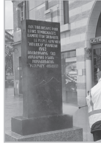
Կարողացե՛ք էք 5

Մ եր հողվածն իրենց կայքէջերում, Ֆեյսբուքում, այլ հարթակներում գետնել էին «Նիդերլանդական օրագիրը», Չեխիայի «Օրերը», այլ լրատվամիջոցներ, այդ բարբարոսական արարքին անդրադարձել էին «Ինտերկապ» եւ այլ հասարակական կազմակերպություններ, ինչի համար շնորհակալ ենք: Բոլորիս համատեղ ջանքերով հարցը լուծվեց: