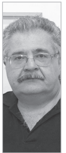
Նյութերը՝ Հայկ ԳԵՎՈՐԳՅԱՆԻ

Իսկ ինչո՞վ է զբաղված ընդդիմությունը: «Ընդդիմությունը դեռեւս ձեւանում է, թե ընդդիմություն է: Հատկապես՝ Էդմոն Մարությանը, Գագիկ Ծառուկյանը: Ես չեմ ուզում որեւէ մեկին պիտակավորել, սակայն նման ուժերից ինչ ընդդիմություն: Ո՞ւմ են խաբում, ինչ են ակնկալում: Մոռացել են, թե ոնց էին Նիկոլի կողքը կանգնել, գուցե իրենք մոռացել են, սակայն մարդիկ չեն հավատում, որ նրանք խաբվել են»: