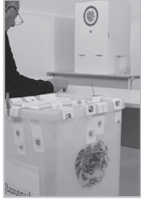
Կարողացե՛ք էք 4

Ա նգրագետ քաղաքացուն իրավունք տալ՝ սահմանադրական հանրաքվեին մասնակցելու գիտությունների դոկտորի հետ հավասար կարգավիճակով, հանցագործություն է: Ինչո՞ւ խառատ ու ֆրեզերագործը, օդաչուն ու ծովայինը... միմյանցից որակապես առանձնացվում են կարգով եւ ըստ այդմ էլ՝ տարբեր իրավունքներ ու պարտականություններ ունեն: