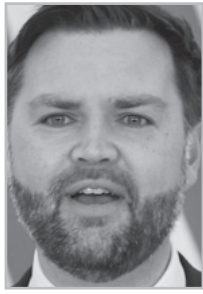
Կարդացե՛ք էջ 4

Դատելով ԱՄՆ փոխնախագահի խոսքից՝ ատոմակայանների արժեքը Հայաստանը պետք է վճարի ամբողջությամբ, իր ունեցած միջոցներից, իսկ վառելիքը եւ սպասարկումը կարվեն այլ մեխանիզմով, հնարավոր է՝ ԱՄՆ-ի կողմից տրամադրվի վարկ: Ձեռքի Վենսը չի էլ թաքցնում, որ դրա արդյունքում մեծանալու է ԱՄՆ-ի էներգետիկ անվտանգությունը: