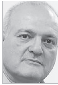
Կարդացե՛ք էջ 5

Լինելով թույլ, պարտված, ոչ էֆեկտիվ իշխանություն, որը հայակենտրոն չէ եւ երրորդ կողմի շահերն է սպասարկում, ոչ թե համադրել աշխարհաքաղաքական տարբեր ուժային կենտրոնների շահերը, այլ խաղալ նրանց հակասությունների վրա, ինչն այնպիսի երկրների դեպքում, ինչպիսին մերն է, շռայլություն է, պարզաստ՝ հիմարություն: