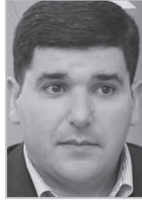
Կարդացե՛ք էջ 5

Արդե՞քանը փորձում է ջնջել ամեն բան, ինչը կարող է վկայել անցյալում իր կախվածության մասին: Միայն ԽՍՀՄ հիշողությունից ձերբազատվելը չէ հարցը: Բաբուն պետական համակարգի ցենտրալիզացիայի կուրս է վերցրել, ինչի վկայությունը Նախիջեանի Ի-3 նոր սահմանադրության նախաբանն է, որ այն Ադրբեջանի անբաժանելի մասն է: