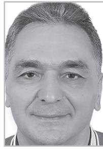
Կարդացե՛ք էջ 5

Մ ի կողմից, լուսանկարներ մրցակիցների հասցեին, մյուս կողմից՝ պատումներ սեփական հաղթանակների մասին: Նույնիսկ արդեն սկսել են խոսել, որ պատերազմի սխալներ չեն եղել: Շուտով, երեւի, կսկսեն ասել, որ մենք տարել ենք բարոյական հաղթանակ: Որ 120 հազար արցախցիների դեպորտացիան հենց այդ հաղթանակի վկայությունն է: