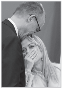
Կարդացե՛ք էջ 4

Բ րիտանական The Telegraph-ը հոդված է հրատարակել՝ «Մեյդոնի Մակրոնին կտրում է Եվրոպայի շարժիչից, Իտալիայի վարչապետը միանում է Գերմանիայի կանցլերին՝ մայրցամաքն ավելի պահպանողական ուղղությամբ տանելու», որի իմաստն այն է, որ Եվրոպայում Ֆրանսիա-Գերմանիա դաշինքին փոխարինելու է գալիս Գերմանիա-Իտալիա դաշինքը: