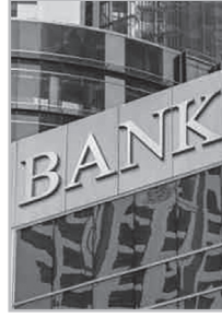
Կարդացե՛ք էջ 6

Ս աթայան է, թե՛ ոչ: Ձեռական առումով՝ բանկերը գործում են օրենքի շրջանակում: Պայմանագրերը ստորագրված են, տոկոսները նշված են, ոչ ոք զենքով չի ստիպում: Բայց սոցիալական առումով՝ երբ մարդը տարիներով աշխատում է միայն տոկոս փակելու համար, երբ վարկը չի օգնում դուրս գալ աղքատությունից, այլ խորացնում է այն: