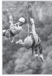
Կարդացե՛ք էջ 5

Հ ալ-Էստրիմը վայելելու համար բոլորովին էլ պարտադիր չէ բարձրանալ Կիլիմանջարո, Էլբրուս կամ անցնել մեռած կանյոններով, օձառատ ավազուտներով ու անմարդաբնակ վայրերով: Դրա համար ընդամենը պետք է այցելել Էստրիմի երկիր Յայաստան, տեղավորվել ցանկացած քաղաքի կամ գյուղի հյուրանոցում, հանգրվանում և սպասել: