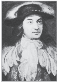
Կարդացե՛ք էջ 4

Եթե հայն ինքնուրույն չկարողացավ ազատագրվել, միակ հույսը մնում է ավելի ատելի տիրապետությունն ավելի տանելի տիրապետությամբ փոխարինելը: Բայց երբ հույսը օտարն է, մնում է գնալ Իսրայել Օրու ճանապարհով՝ գնալ այլ մայրաքաղաքներ եւ համոզել, որ գան եւ ազատագրեն աշխարհի ամենաքրիստոնյա եւ ամենաընկերակց ժողովրդին: