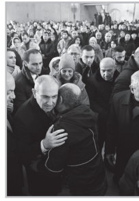
Կարդացե՛ք էջ 5

Երկրի ղեկավարը վաղուց է բացահայտել իրեն՝ նրա խոսքը կտրված է իրականությունից, նրա որոշումները՝ հանրային շահից, նրա վարքը՝ պետական պատասխանատվությունից: Նրա հետ խոսելն անիմաստ է՝ նա չի լսում, չի ուզում լսել, նա ընտրել է իր ճանապարհը եւ պատրաստ է անցնել այն մինչեւ վերջ՝ անկախ գնից: