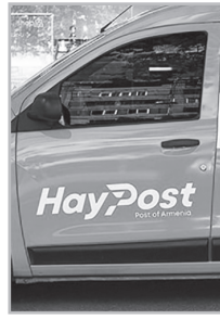
Կարդացե՛ք էջ 5

Ք աղաքացին ցանկացել է «Չայփոստով» ծանրոց ուղարկել ԱՄՆ-ում բնակվող իր բարեկամին՝ օրենքով չարգելված իր: Ապրանքը կշռել է, ասել են՝ պետք է տեղափոխման ծառայության համար վճարի՝ 1 կգ-ի դիմաց 10 հազար դրամ, բայց նրանից եւս 10 տոկոս հավելավճար են պահանջել: ասել են՝ ԱՄՆ նախագահի կողմից սահմանված մաքսատուրքն է: