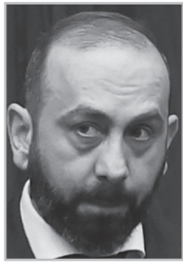
Կարդացե՛ք էջ 4

Ա րարատ Միրզոյան-2026-ը հանդես է գալիս, ինչպես ասում են, նույն «կորպուսով», բայց ունի, կարծես, նոր կարգավորումներ՝ բարկանալ, տաքանալ, խոսել արտահայտիչ ժեստիկուլյացիայով, օգտագործել մանիպուլյացիոն համեմատություններ, հերքել ամեն ինչ ու ամեն կերպ, կիրառել արտիստիզմ, օգտվել Փաշինյանական լեքսիկոնից: