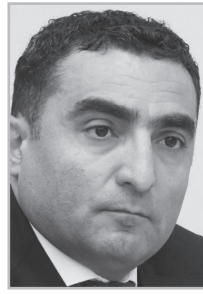
Կարդացե՛ք էջ 5

Եթե կառավարության ու Ռոմանոսի չհաջողվի մինչև ընտրություններ ԴԵՑ-ը վերադարձնել, նրանց շեֆը լրջագույն բարոզական խնդիրների առջև է կանգնելու: Որ Հաբան Ֆիդանը Կայա Կալասի ձեռքն էլ բռնած գա՛ չեն կարողանալու մեր հանրությանը համոզել, որ իրենք գող չեն, փիլիսոփա են: Թե դրանք ուր, փիլիսոփայությունն ուր: