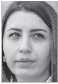
Կարդացե՛ք էջ 4

Ոչ մի թշնամական գործողություն, անգամ մտադրություն աննկատ չի մնում Զրիստինե Գրիգորյանի հիմնարկի ուշադրությունից, հաստատ նա ևս պարզապես ստացողների թվում է: Մնում է մի հարց պարզել. այս գեկույցը գրվել է Հայաստանում ԱՄՆ դեսպանի, թե՛ Նիկոլ Փաշինյանի աշխատասենյակում, թե՛ մեկը գրել է՝ մյուսը խմբագրել: